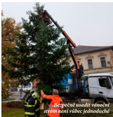
Bezpečně usadit vánoční strom není vůbec jednoduché

Potěšitelné je, že provoz v ulici Havířská a K Nouzovu již bude klidný , neboť odbor dopravy konečně vyhláškou schválil místní úpravu provozu a došlo k instalaci dopravních značek o zjednosměrnění provozu. Také obyvatelé ulice