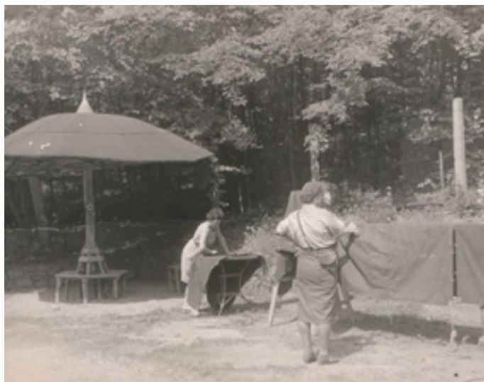
Foto oblíbeného výletního místa, kam chodili i lázeňští hosté ze Svatého Jana

Zajímavá (a dnes těžko představitelná) byla také informace, že se neodvážel všechn vytěžený vápenec, jen kameny o velikosti „dvou pěstí nebo tzv. dětské hlavy“ a že lomař musel za den naložit 10-12 vagónků, což obnášelo minimálně 10 tun ručně přemístěného kamene.