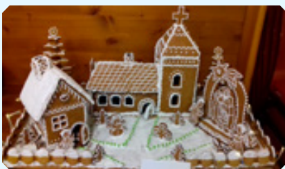
Perníkový betlém z dílny paní Bálintové

Uvítáme, pokud nám své příspěvky do příštího čísla zašlete do 10. 12. 2022 na e-mail: zpravodaj@lodenice.cz