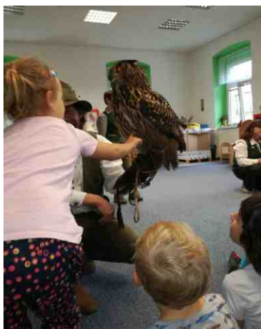
První letmé pohazení

To, že v naší mateřské škole probíhají zajímavé akce, již z našich článků jistě víte. Tentokrát byla akce nejen zajímavá, ale dá se říci, že i rekordní. 23. října se totiž do celkem malé jídelny vměstnalo 45 dětí a 25 dospělých. Cílem jejich konání bylo vydlabat co nejhezčí a neoriginálnější dýně. Atmosféra byla hodně pracovní. U stolků se v mnoha případech sešly celé rodinné týmy. Rodiče i prarodiče, mi v tom tvůrčím zápalu splývali s dětmi. Jejich nadšení občas předčilo i to dětské. Výsledkem konání bylo nespočet krásných symbolů podzimu, které učitelky následující ráno vybavené i hořícími svíčkami vystavily po celé školce. Vyzdobily jimi nejen schodiště, ale i šatny a tak měli děti