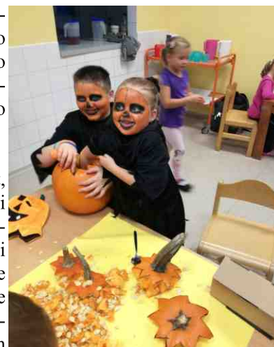
Tyhle děti přišly dokonale připravené

i rodiče krásnou připomínku předchozího dne na očích znovu a to v téměř magické atmosféře probouzejícího se dne. Aby toho nebylo dost, hned dopoledne děti měly možnost seznámit se s vzácnými dravci. Mohly si je nejen pohladit, ale dověděly se, co nejraději jedí, jak se k nim chovat, ale i jak je chránit ve volné přírodě. Pro děti to byl asi opravdu velký zážitek. Když jsem se s odstupem pár dnů zeptala Fildy, mého malého kamaráda, co chodí do školky, hned mi všechno kolem dravců vysvětlil. A to jsem se nestačila divit. Spousta mi toho to čtvrté dopoledne asi unikla.