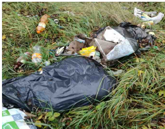
Čekáme na majitele, snad se dočkáme.

Na spojovací cestě ulic Za Vinicí a Školní opět něco přebývá. Již delší dobu tam má někdo odložen svůj majetek ve formě pytlů s odpadem a další nepořádek. Prosím toho, kdo si takto odložil, aby se o svůj majetek náležitě postaral. Jako nejlepší místo pro uložení doporučuji sběrný dvůr. Nerozumím tomu. Vždyť i na tuto černou skládku musel věci někdo dovést a pak ještě kus nést. Při vjetí do sběrného dvora a zastavení přímo u příslušného kontejneru by nikdo nemusel vynaložit tolik energie jako v tomto originálním a zcela nežádoucím způsobu úklidu. O příkladu pro děti, které tu chodí do školy, je snad zbytečné psát.