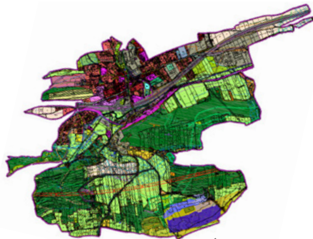
Územní plán Loděnice