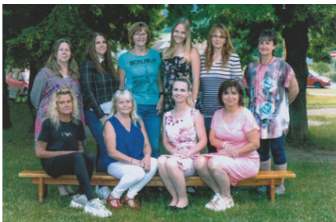
Kolektiv MŠ Loděnice ve šk. roce 2022–2023

Je to neuvěřitelné, ani jsme se nerozkoukali a další školní rok je za námi. Máme tu dobu prázdnin, dovolených a letních aktivit. Uplynulý školní rok byl pro nás plný společných aktivit, akcí a událostí, na které nám zůstávají pěkné vzpomínky. Děti viděly mnoho divadelních představení, užily si výlety i tematické akce,