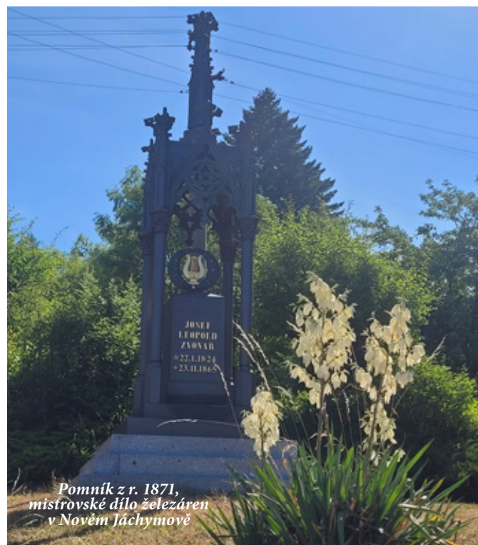
Pomník z r. 1871, mistrovské dílo železáren v Novém Jáchymově

Červencová vedra a neustálá varování meteorologů a lékařů před vysokými teplotami vedla k úvaze tentokrát výlet zrušit. Na zastávce autobusu, kde byl sraz, se nakonec ale čtveřice nadšenců (vyzbrojena chytrými telefony s navigací a vzdálenou podporou případného odvozu v případě nouze) rozhodla přece jen vyrazit. Jízda v klimatizovaném autobusu byla příjemná, čekání na přestup na berounském sídlišti se dalo přežít ve stínu, nepovedlo se jen vystoupit na správné zastávce a tak jsme k pomníku hudebního skladatele Josefa Leopolda Zvonáře, kde byl rozcestník značených cest, museli sice ještě trochu popojít, ale zato jsme viděli, kde stojí jeho rodný dům. Zaujala nás také obrovská budova mateřské školy a tablo s pouhými sedmi předškoláky. (Strýček Google ovšem prozradil, že celé první patro zaujímá expozice přístupná po domluvě s místním obecním úřadem. A OÚ může mimořádně otevřít i místní kostelík, který je jinak otevřen jen v neděli po dobu mše. Zajímavé je, že Kublov má pouhých 650 obyvatel, ale je tu kromě SDH a zahrádkářů a myslivců i spolek Kublováček, který pořádá akce pro děti, a překvapivě také Spolek mopedistů.). My jsme pokračovali příjemnou lesní cestou s řadou laviček až ke kostelu s nádherným raně gotickým portálem, prošli kolem místa posledního odpočinku autora písně Čechy krásné, Čechy mé (vybaveného QR kódem) a vystoupali na legendární starověký Velíz, na němž někdo vytvořil i „podobiznu“ pohanského boha Velese, který tomu-