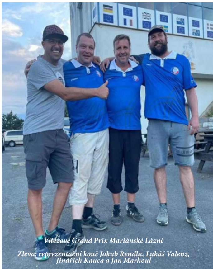
Vítězové Grand Prix Mariánské Lázně