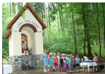
Děti z Vysokého Újezda u kapličky sv. Antonína U Tří habrů