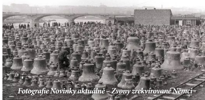
Fotografie Novinky aktuálně – Zvony zrekvírované Němci