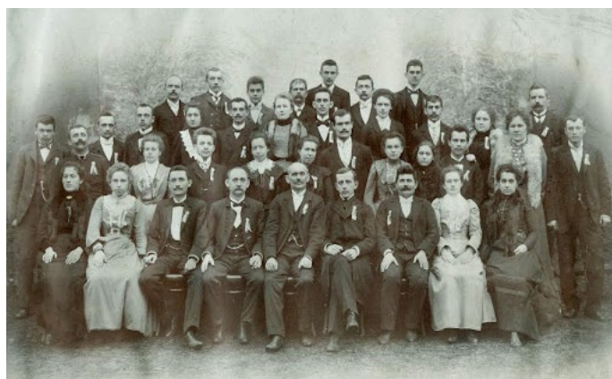
Foto členů ochotnického souboru z roku 1903

divadelní představení „Havlíček Borovský“.