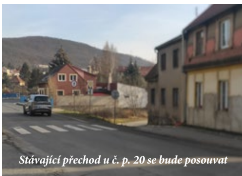
Stávající přechod u č. p. 20 se bude posouvat

- poskytnutí dotace ve výši Kč 15.000,-- organizaci Charita Beroun, Cajthamlova 169, 266 01 Beroun;