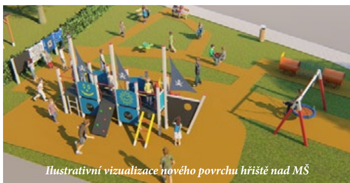
Ilustrativní vizualizace nového povrchu hřiště nad MŠ

Celé zápisy z jednání Rady obce najdete na webových stránkách obce www.lodenice.cz (v části „Samospráva“ a „Zápisy z jednání rady“).