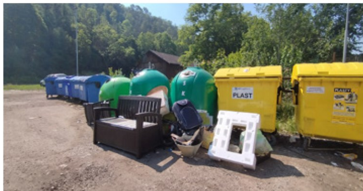
Doufáme, že jde o „dílo“ přespolních

Příkladem mládeže ale bohužel nejdou ani někteří dospělí – u kontejnerů na tříděný odpad (a často i v nich) je možné vidět odpad, který tam nepatří, případně není vytríděný . Černá skládka hned vedle sběrného dvora o tom svědčí dost výmluvně. Je dobře, že i tady obec nechala nainstalovat kamery a nehodlá takové jednání tolerovat.