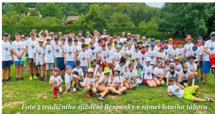
Foto z tradičního sježdění Berounky v rámci letního tábora

Od září se budeme opět věnovat tréninkům na základní škole, ale také Baby judu v bývalém kině. V tělocvičně na základní škole v Loděnici budou tréninky probíhat ve stejném čase jako doposud, tedy v pondělí a ve středu od 15:00 do 16:00 hodin. Zároveň bychom rádi pozvali nové zájemce o judo, aby