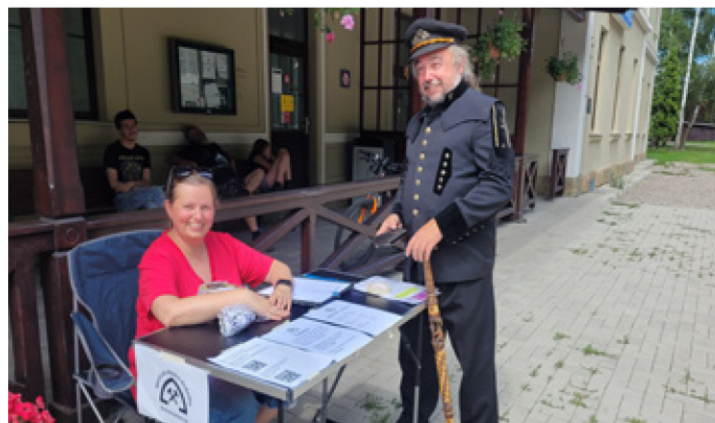
Již u registrace bylo možné klást dotazy a prohlédnout si dobovou hornickou uniformu

Živo tu bylo i 12. 8., neboť právě odtud startovala trasy B Memoriálu Mikiho Dobrého. Trasa A pro zdatnější chodce začínala v Berouně, ale všichni se pak v odpoledních ho-