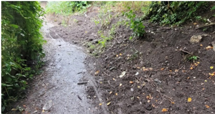
Ukázka devastace deštěm a prasaty