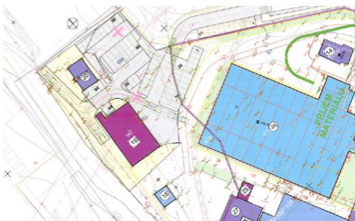
Vybudování nových stání u GZ Media

Zveme občany na VEŘEJNÉ ZASEDÁNÍ obecního zastupitelstva, které se koná ve středu 20. září 2023 od 18:00 hodin ve velkém sále Kulturního zařízení.