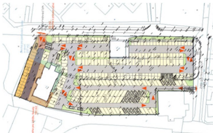
Rekonstrukce stávajícího parkoviště u GZ Media

Podmínky pro vybudování nových stání: příjezdová komunikace včetně opěrné zdi vedoucí přes pozemky obce bude vybudována na náklady GZ Media, a. s.; 11 nových parkovacích míst pro obyvatele obce Loděnice bude vybudováno na náklady GZ Media, a. s.