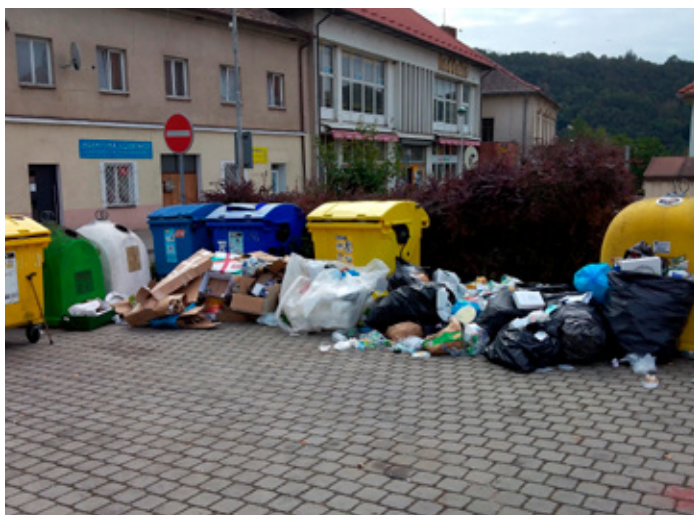
Optimalizace počtu kontejnerů na sběrném místě za MŠ v praxi

Druhý k tématu, které řeší i ředitel základní školy.