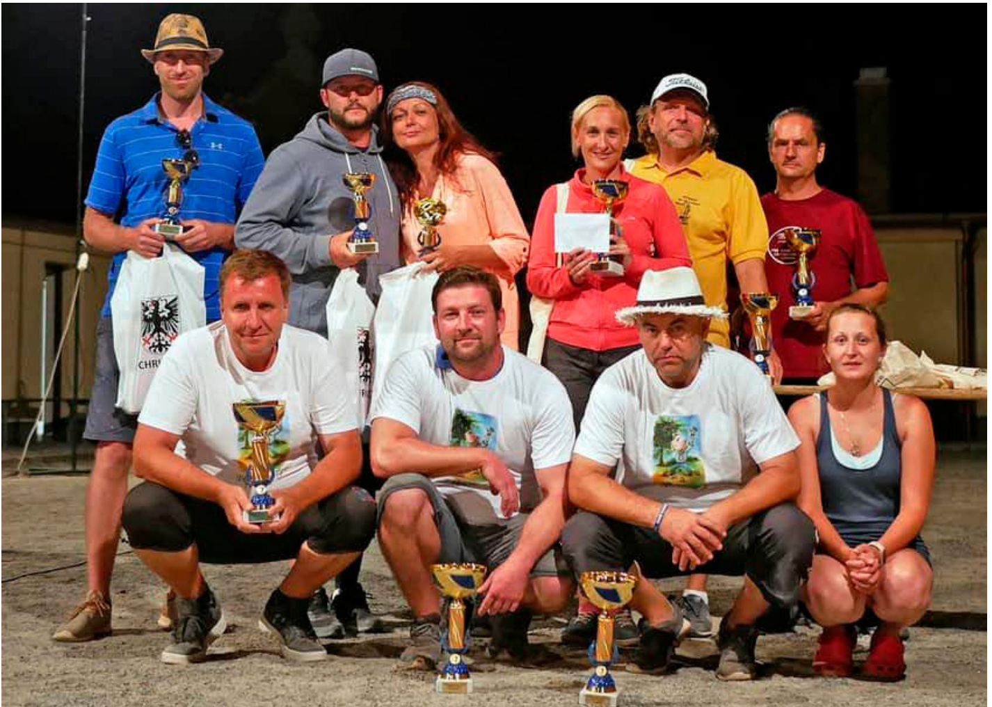
Prestižní turnaj v Hrochově Týnci - medailisté