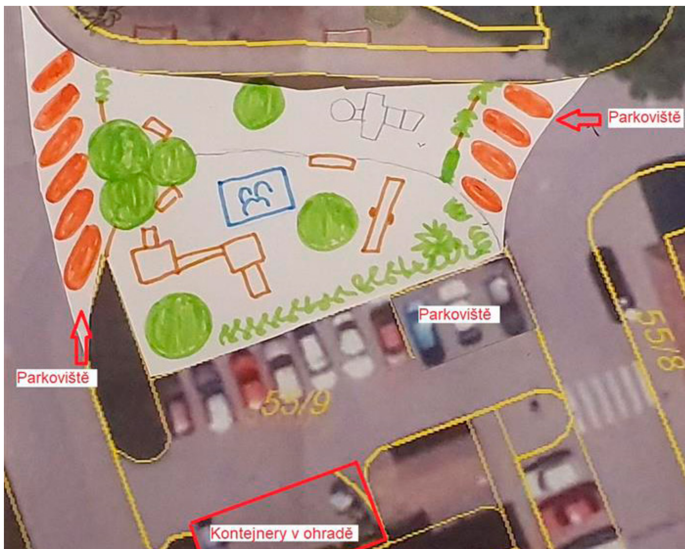
Revitalizace horní části náměstí - náčrtek