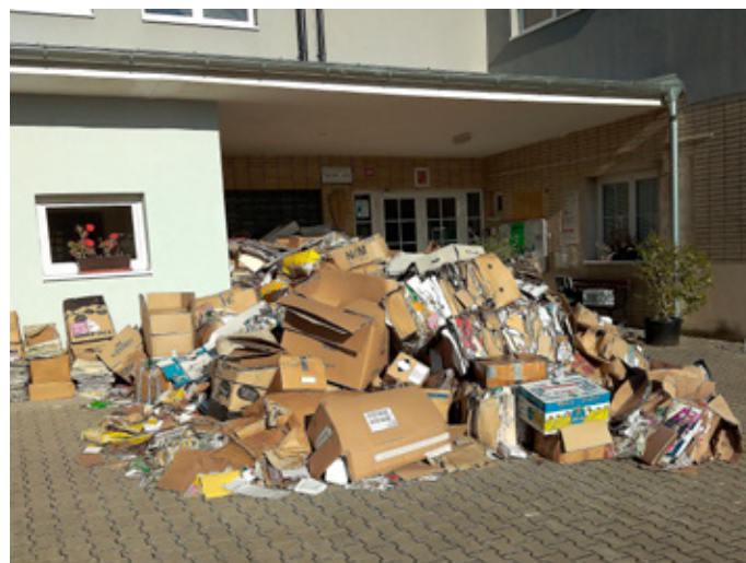
Nové způsoby protipožární prevence v ZŠ Loděnice