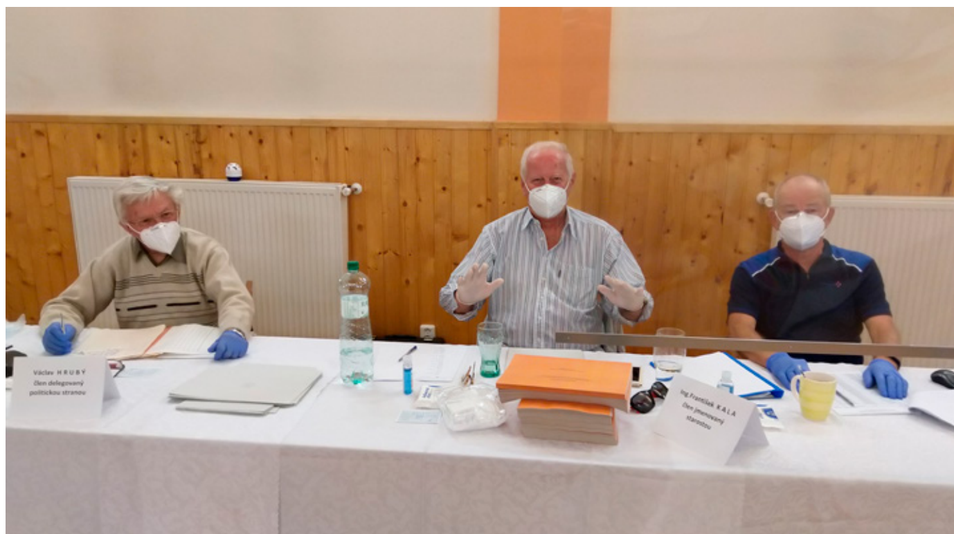
Ve volební komisi vládla opravdová pohoda

Jako vždy jsme si tipovali volební účast. Ta letošní s hodnotou 40,35 %, předčila všechna naše očekávání. Při porovnání s těmi posledními krajskými mě zaujal počet shodný počet voličů zapsaných na volebním seznamu. Bylo nás 1378. Těch, kteří přišli volit, však bylo o 109 více.