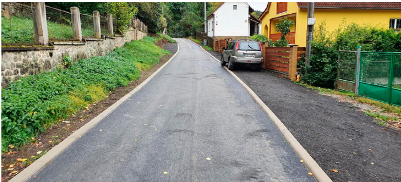
Výsledek opravy stojí za to

Poznámka redakce: Rekonstrukce probíhala v srpnu a září 2020 – Dokumentační foto z průběhu stavby najdete na webových stránkách obce – autorem je Martin Bok