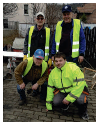
Nakonec se část čety nechala přesvědčit k focení

Znají už i dny, po nichž je vždy úklid náročnější. Po dnech odpoledního školního vyučování jsou to schody ke kostelu, které se stávají místem poledních pikniků dětí. Po víkendu je to zase část Plzeňské ulice. Libovali si, že během jarních prázdnin zůstal ušetřen i nedávno důkladně uklizený prostor u studny, kde se děti schází po vyučování.