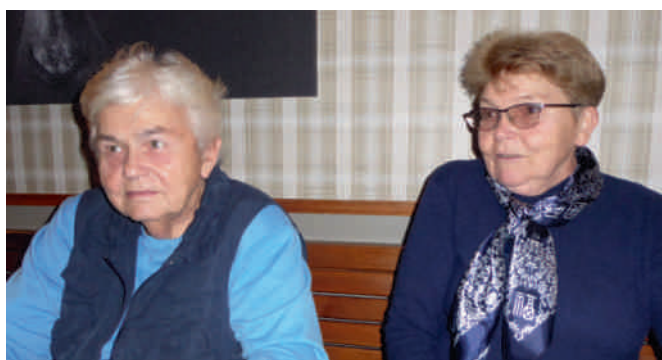
Příprava setkání s jedním z pozvaných hostů probíhala v Loděnické Pizzerii

Připravili jsme pro vás prezentaci výsledků téměř detektivního pátrání po osudech rodů, které jsou s historií Loděnice těsně spjaty a které se velmi zasloužily o její rozvoj a rozkvět. První beseda z této série bude věnována rodu Cífků, jehož potomky se nám podařilo vypátrat a pozvali jsme je.