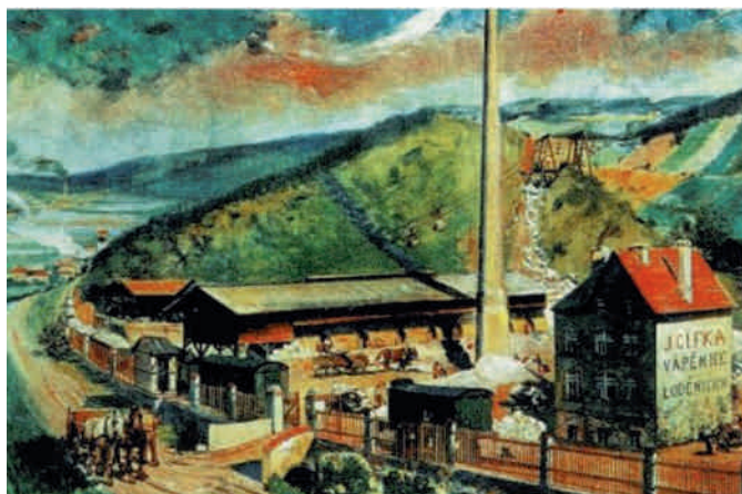
Jistě bude zajímavé porovnat obec v roce 1900 a předměstí Prahy v roce 2020 - na obrázku Cífkova vápenice.