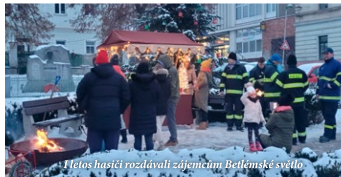
I letos hasiči rozdávali zájemcům Betlémské světlo

- smlouvu o dílo č. 841/TC/DC/2022/057/DCLW „Rekonstrukce ulice Šeříkové – obec Loděnice; dešťová kanalizace“. Smlouva bude opět uzavřena s firmou Strabag, která tuto ulici rekonstruovala, neboť jinak by se na rekonstrukci nevztahovala pětiletá záruka.