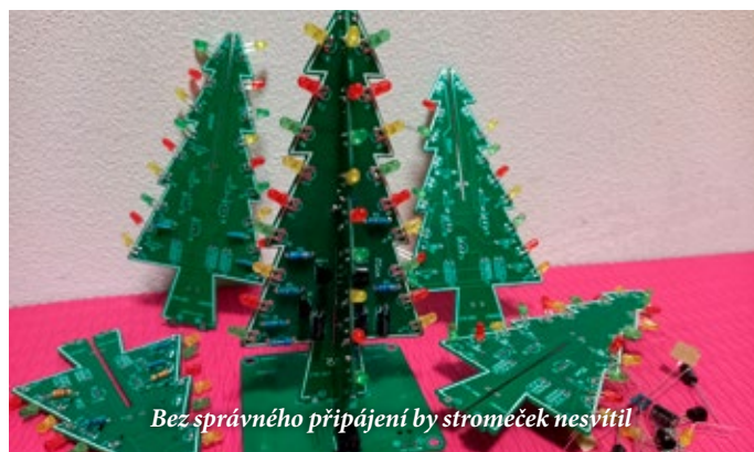
Bez správného připojení by stroměček nesvítil

Vánočně se pracovalo i v robotickém kroužku – děti tu v adventním čase zapojovaly diody a odpory, aby se jim povedlo rozsvítit a barevně rozblíkat roztomilé malinké vánoční stroměčky.