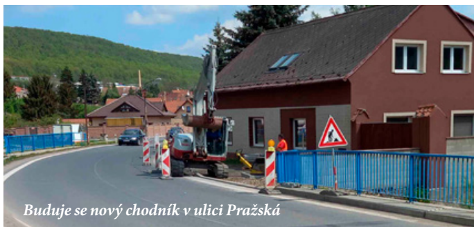
Buduje se nový chodník v ulici Pražská