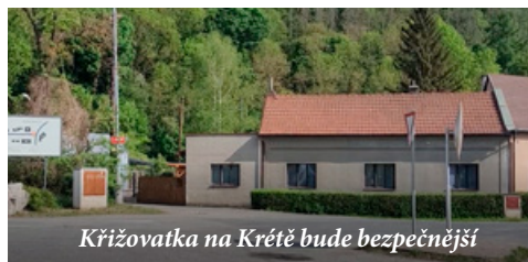
Křižovatka na Krétě bude bezpečnější

Jen chodníky v ulici Za GZ slouží bohužel stále z velké části k jinému účelu. Je patrné, že do GZ jezdí stále více zaměstnanců automobilem, kapacita parkoviště dávno nestačí, a tak auta parkují prakticky všude - na chodnicích, na trávnících, v souvislé řadě v jednosměrce, někdy i v křižovatce. Situace je stále zoufalejší a dlouhodobě se neřeší.